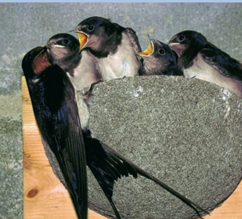
Eine Rauchschnalben-Familie in ihrem Kunstnest.

Nestgrundlage können Sie Brettchen anbringen, die mit Kaninchen- draht überzogen sind. Manchmal genügt auch schon ein 10 bis 15 cm breiter, weiß gestrichener Rauputzstreifen unter dem Dachvorsprung.