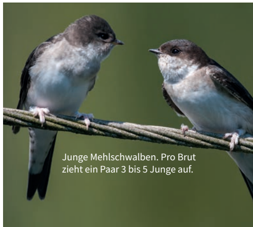
Junge Mehlschwalben. Pro Brut zieht ein Paar 3 bis 5 Junge auf.

dass sie hauptsächlich in urbanen Räumen zu finden ist. Sie baut ihre Lehmester direkt unter Dachvorsprüngen an rauen Außenwänden, in Balkonnischen oder auch unter Brücken. Sie brütet ein- bis zweimal, in Ausnahmefällen auch dreimal im Jahr.