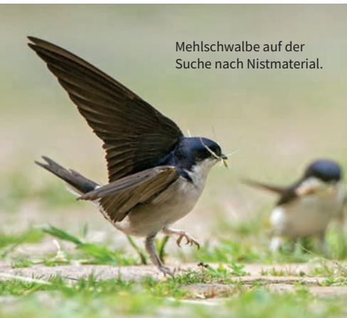
Mehlschwalbe auf der Suche nach Nistmaterial.