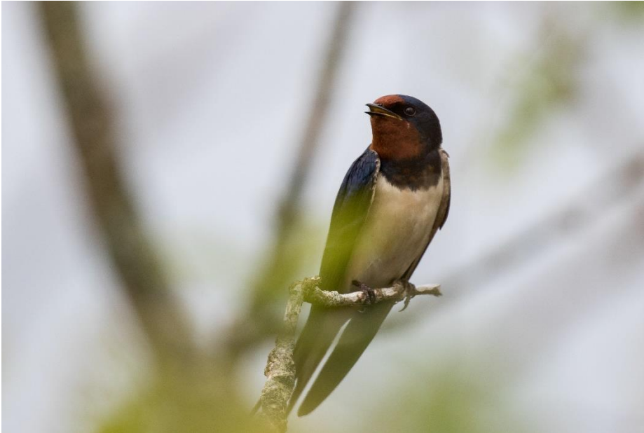
Rauchschwalbe mit charakteristischer braunroter Färbung von Kehle und Stirn.

Straßenpfützen. Innen ist das Nest mit Gras und Federn ausgepolstert. Die Hausschwalben haben zwei, gelegentlich auch drei Jahresbruten. Schwalben sind gebietsstreu Arten, sodass Alt- und Jungvögel im Folgejahr in die nähere Umgebung der Brutheimat zurückkehren.