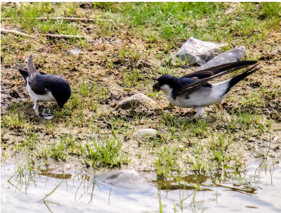
Mehlschalben bei der Sammlung von Nistmaterial.

In den "Roten Listen" sind ausgestorbene, verschollene und gefährdete Tier-, Pflanzen- und Pilzarten, Pflanzengesellschaften sowie Biotoptypen und Biotopkomplexe aufgeführt. Durch diese Fachgutachten wird der Gefährdungsstatus für einen bestimmten Bezugsraum anhand der Bestandsgröße und der Bestandsentwicklung dargestellt.