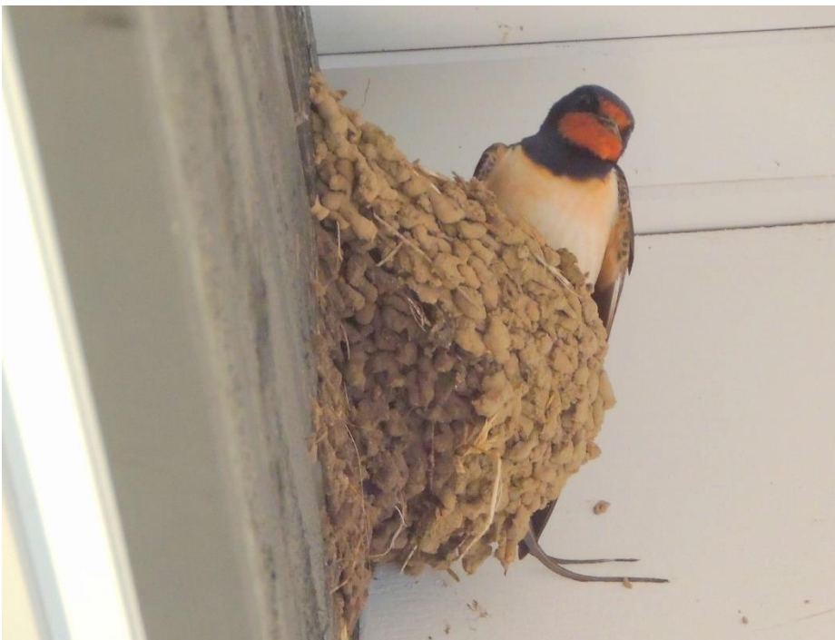
Rauchschwalbe am gebauten Nest.

Rauchschwalben bauen ihre Nester im Inneren von Ställen, Scheunen oder anderen Gebäuden an Balken, Wänden oder Mauervorsprüngen. Für sie genügt es, ein einfaches Holzbrett als Nisthilfe am bzw. im Gebäude anzubringen. Für Rauchschwalben sollten Fenster und andere Öffnungen von Ställen und Scheunen offengehalten werden.